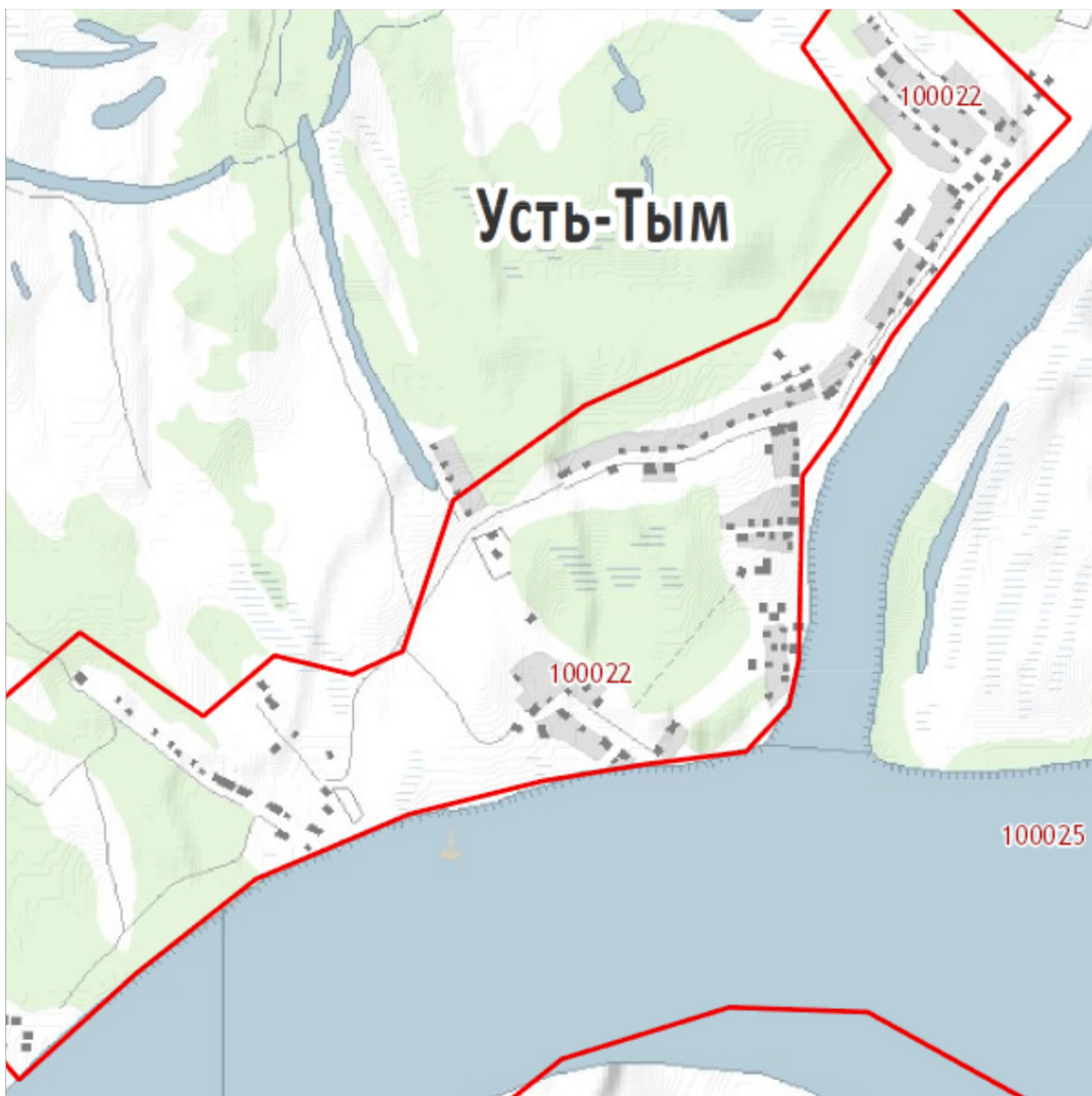
Приложение 2. Схема административного деления с указанием расчетных элементов территориального деления (кадастровых кварталов).